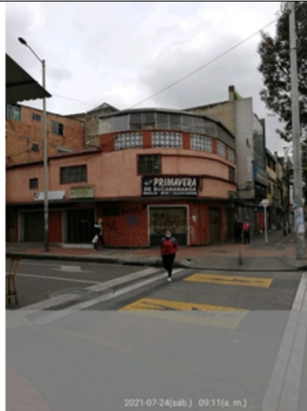
Foto No. 2: Vista del predio donde se evidencia que la valla fue desmontada del predio con nomenclatura Diagonal 44 Sur No. 52-05 (dirección registrada) y/o Calle 45 A Sur 53 A 01 (dirección catastral), orientación visual Sur - Norte.