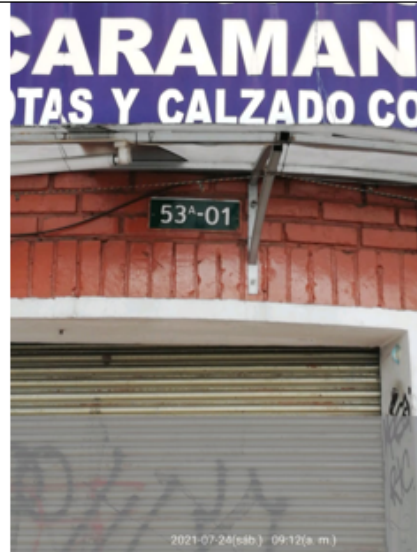
Foto No. 1: Vista de la nomenclatura del predio donde se ubicaba la valla en la Calle 45 A Sur 53A 01 (dirección catastral), orientación visual Sur - Norte.